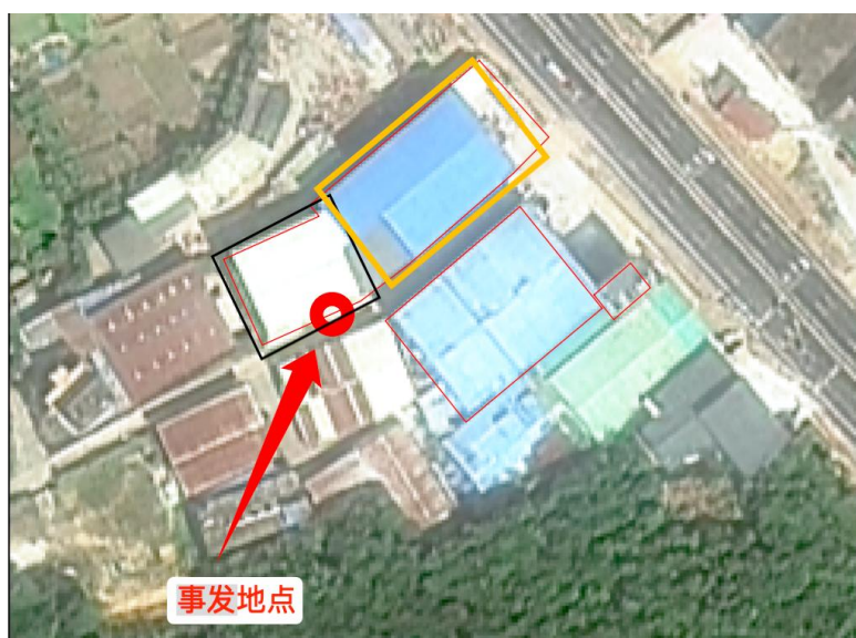
图1 惠州市惠阳区瑞富实业有限公司厂房平面图

惠阳新圩瑞富实业钢棚加固升高及楼面制作安装工程（以下简称“安装工程”）位于惠阳区新圩镇约场新清大道与948乡道交叉口东南480米处，施工作业地点为惠州市惠阳区瑞富实业有限公司厂房中的一栋钢结构厂房（如图1黑色标注厂房所示，以下简称“事故厂房”）。厂房用地未办理用地批准手续，该工程未办理建筑施工有关手续或有关部门备案。工程主要施工内容为：对原有钢棚进行加固并整体升高约9米，同时对二层主体钢结构及部分顶面瓦进行制作安装，工程总造价为17.48万元。