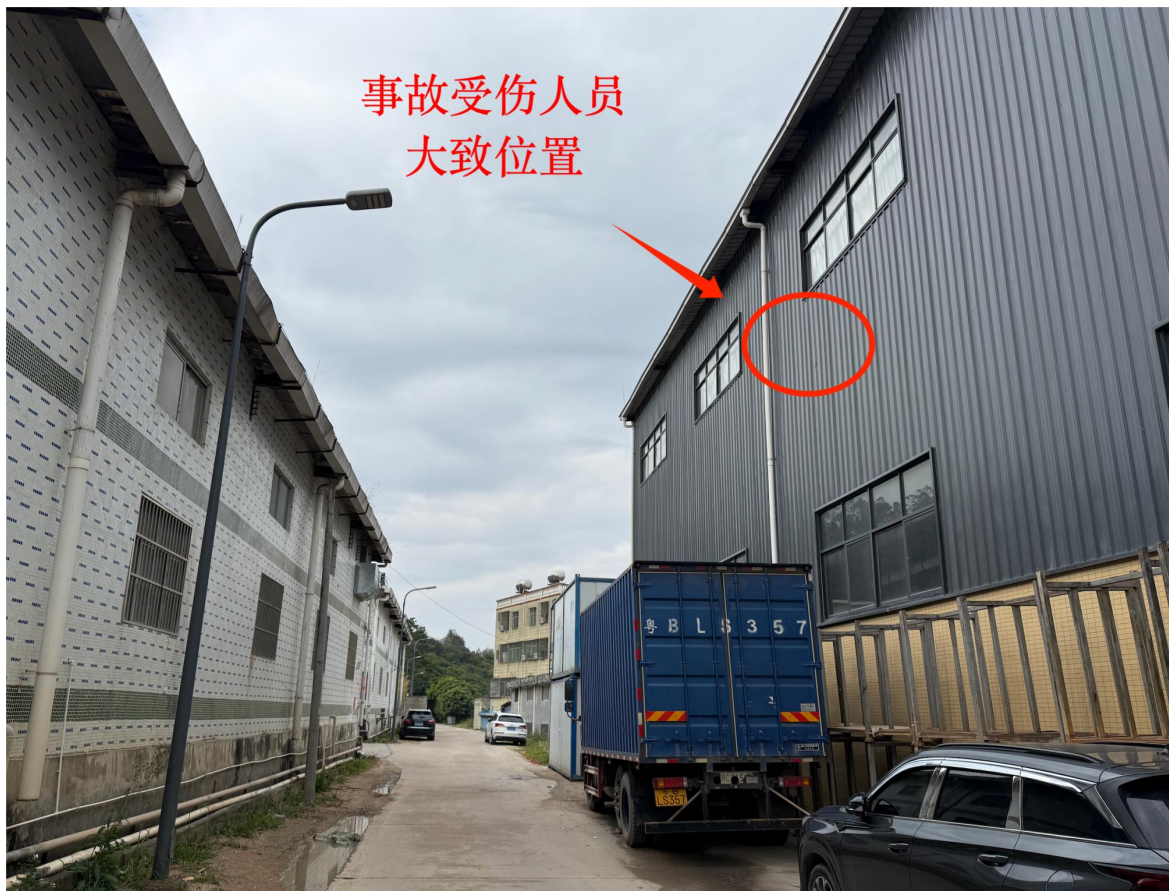
图2 事故厂房已完工现状图（图中右侧灰色厂房为事故厂房）